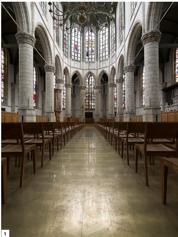
1 – Zicht richting het oosten door het langgerekte koor. Hier zijn enkele van de wereldberoemde Goudse glazen te zien.