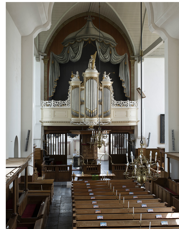
Zicht op het interieur richting het oosten. Koor en schip zijn van elkaar gescheiden door een koorhek, waarvoor preekstoel, dooptuin en orgel zijn geplaatst. Boven het orgel een schildering van een baldakijn.