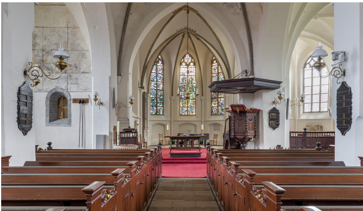
Zicht op het grote koor aan de oostzijde van de kerk. Rechts tegen een pijler staat de zeventiende-eeuwse preekstoel, op de grens van de twee koren en het schip.

intact. Dit doet vermoeden dat de maatregelen van het nieuwe regime in Delden niet zo strikt zijn opgevolgd. In de negentiende eeuw ontstond een dringende behoefte aan meer zitplaatsen. Waar voor die tijd de vloer vrij moest blijven vanwege het begraven in de kerk, kwamen nu rondom de preekstoel en het doophek overal banken in een zeer hoge dichtheid. Vlak voor het doophek was plaats voor open banken, daaromheen, in vlakken verdeeld, banken met deurtjes en achteraan overhuifde banken. Aan de westzijde kwam een galerij met een orgel, gemaakt door C.F.A. Naber (1796-1861).