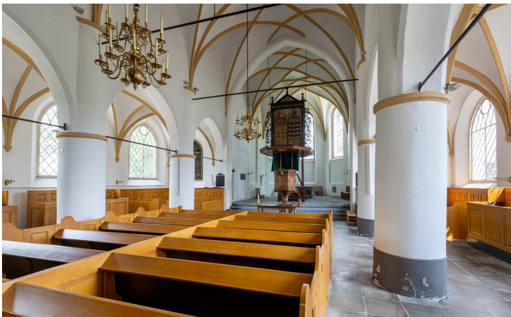
Zicht richting het oosten in de Martinuskerk in Rijswijk. De negentiende-eeuwse preekstoel staat in het midden op de grens van schip en koor.

Het is niet zeker of de oude preekstoel oorspronkelijk aan de zuidzijde van het schip stond. De huidige plek werd mogelijk al gekozen in 1658, toen men Johan Joostensz van Coten opdracht gaf voor de vervaardiging van het genoemde tekstbord. Dit bord is ook beschilderd aan de achterkant, de kant van het koor. Hier staan het Onzevader, de geloofsbelijdenis en twee Bijbelteksten die betrekking hebben op de sacramenten doop en avondmaal. Dat maakt duidelijk dat het avondmaal in het koor werd gevierd.