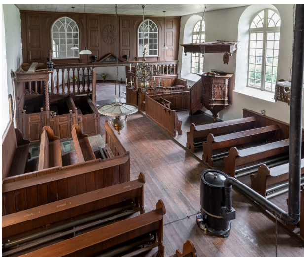
Zicht vanaf het orgelbalkon. Tegen de zuidwand staat de preekstoel met doophek, ertegenover de Ripperdabank. In het schip staan twee rijen met burgerbanken.

1738 nogmaals, toen het bord werd overschilderd ten behoeve van een ander familielid. Diverse grafzerken maken duidelijk dat ook hier in de kerk werd begraven. Ook in Oosterwijtwerd zal na 1795 de verplichte verwijdering van de familiewapens en rouwborden een aandachtspunt zijn geweest. Misschien hield men de deuren van het koorhek gesloten. Zo kunnen belangrijke onderdelen in het koor en aan de oostzijde van het schip, waaronder de rouwborden en epitaaf, bewaard zijn gebleven.