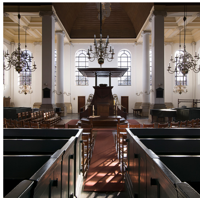
De Nieuwe Kerk in Haarlem is een centraalbouw met een vierkante plattegrond. De preekstoel werd hier niet tegen een wand of kolom geplaatst, maar centraal in de ruimte.

Om de preekstoel kwam een ruimte die werd afgescheiden door een hek. De ruimte zelf werd dooptuin genoemd, omdat hier de doopbediening plaatsvond. Het hekwerk kreeg de naam doophek. De dooptuin had meerdere functies. Liturgisch gezien was het de afgebakende plek voor de doop, reglementair gezien was het de plek waar voorganger en kerkenraadsleden, de ambtsdragers, een plek hadden. Het doophek werd vaak kunstig vormgegeven met panelen en balusters. Het werd voorzien van een lezenaar voor de voorzanger en een of meer doopbogen ter markering van de in- en uitgang van de dooptuin. De plaatsing van een hek om de preekstoel behoorde op veel plaatsen tot de eerste protestantse aanpassingen van het voorreformatoerische kerkinterieur. Voor de kerk van Middelburg vroeg de kerkenraad al in 1574, direct nadat de stad in handen van de geuzen was gevallen, om aan de voet van de preekstoel een tuin te maken. 6 In de Augustijnenkerk in Dordrecht werd in 1575 of 1579 in de boeken genoteerd ‘dat het noodig zal zijn een staketsel om de predikstoel te maken’. 7 Het hekwerk waarvan sprake is in de Zaltbommelse kerkrekeningen van 1603, is het hek dat nog steeds in de Maar-