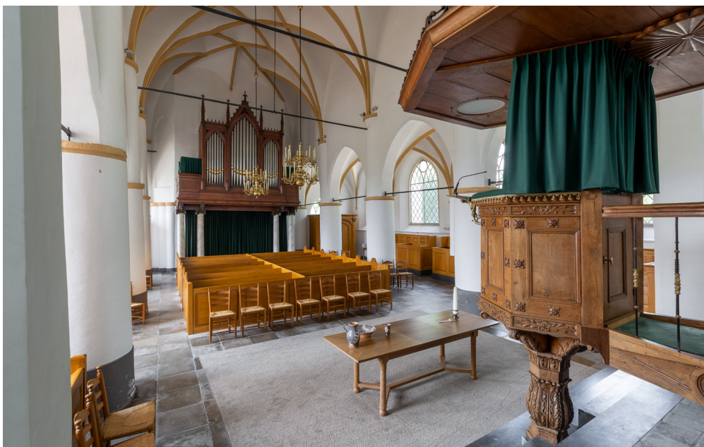
Zicht richting het westen met in het schip het negentiende-eeuwse bankenblok en het neogotische orgel uit 1875.