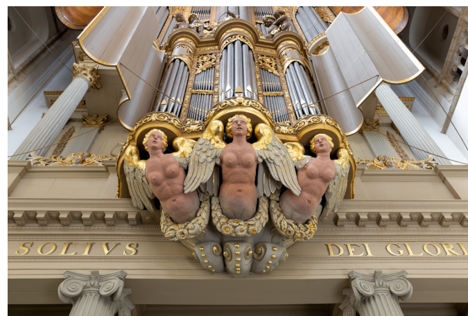
Het Müllerorgel uit 1738 in de Grote of Bavokerk in Haarlem. Vanaf het midden van de zeventiende eeuw kreeg het orgel meestal een plaats aan de westzijde van het interieur.

De westwand van het schip van de Laurenskerk in Alkmaar wordt gevuld met het orgel uit 1639-1646. Het orgel heeft een classicistische kas met fronton, orgelluiken en uitbundig snij- en beeldhouwwerk als decoratie, zoals deze drie gevleugelde vrouwenfiguren.