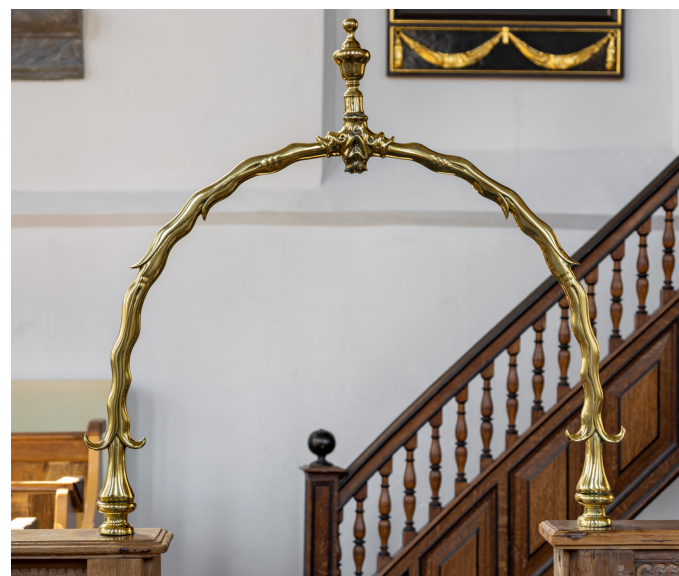
De in- en uitgang van de dooptuin werden vaak gemarkeerd door koperen doopbogen, zoals deze zeventiende-eeuwse boog in de Nicolaaskerk in Krommenie.