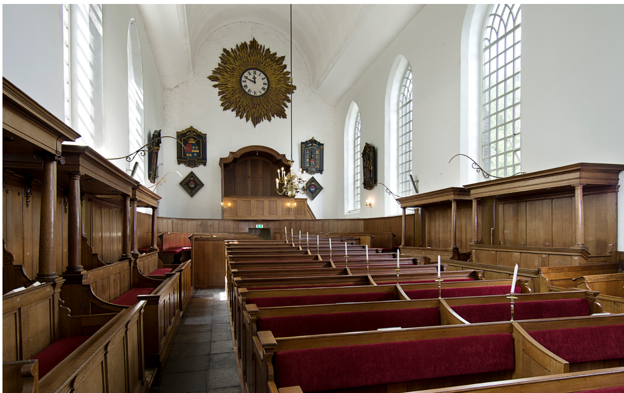
Zicht op het interieur richting het westen. Langs de wanden staat een groot aantal overhuifde herenbanken. Tegen de westwand staat de hoge herenbank voor de bewoners van buitenplaats Vechtstroom.

Het koor van de Pieterskerk is een door het koorhek afgescheiden ruimte en maakt geen deel uit van de kerkzaal. In de zeventiende eeuw werd het koor vermoedelijk gebruikt voor de avondmaalsviering.