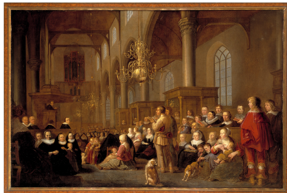
Schilderij van de hand van Gijsbert Sibilla (1635) met het interieur van de Laurentiuskerk in Weesp (RMCC s88). Tussen de preekstoel en de herenbanken is plaats voor burgerbanken en stoelen.

In eenbeukige kerken was de ruimte veel beperkter. Hier kregen de herenbanken een plaats langs de noordmuur van het gebouw, tegenover de preekstoel. In het Friese Dronrijp staan zo nog altijd maar liefst vier grote zeventiende-eeuwse familiebanken op rij tegen de noordmuur van de kerk. In kleine kerken bleef tussen de dooptuin en de herenbank weinig ruimte over voor de gewone kerkgangers. Zij kregen een plek aan weerskanten van het doophek en de herenbank(en). Twee uitzonderlijke herenbanken bevinden zich in het Groningse Midwolde en Noordwolde. De herenbanken aldaar zijn hoogverheven en vertonen veel overeenkomsten met een hoge loge. Ze onderstreepten daarmee dat de gebruikers in reputatie, rijkdom en uitingen van naastenliefde ver uittorenden boven de gemiddelde kerkganger, maar ook de predikant.