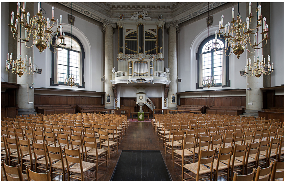
In het achthoekige gebouw bevinden zich tegen de wand tegenover het toegangsportaal de preekstoel en het orgel uit 1779-1783.