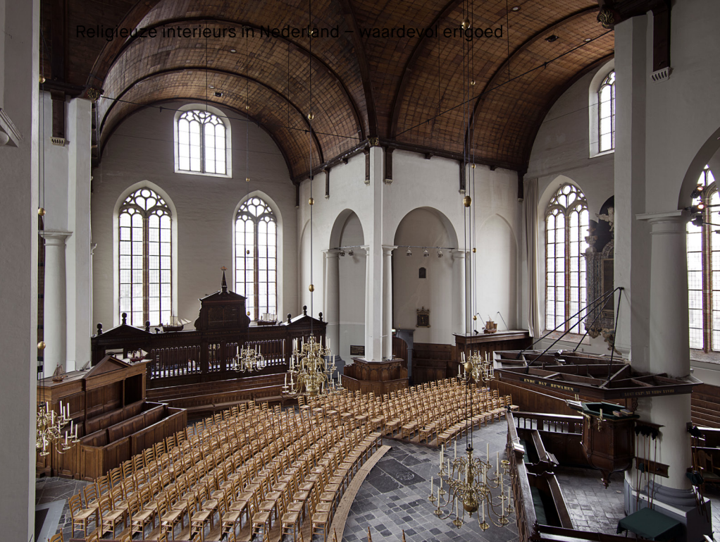
Interieur van de Grote Kerk in Maassluis met centraal de preekstoel met doophek. Tegenover de preekstoel de regeringsbank en daarvoor ruimte voor stoelen.