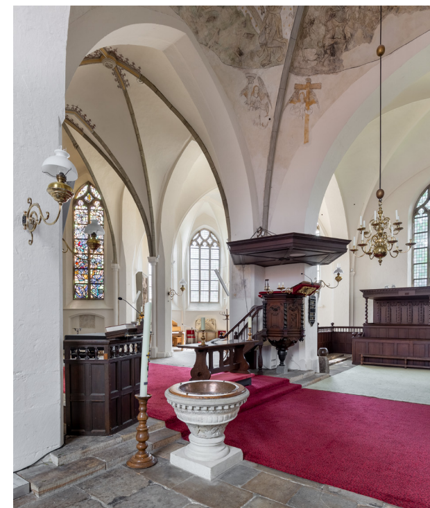
In lijn met de voorschriften van de Liturgische Beweging staan de preekstoel, de avondmaalstafel en het doopvont naast elkaar vooraan, zichtbaar voor alle kerkgangers.