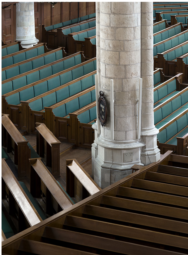
De banken in deze 'kuip' lopen naar achteren toe in hoogte op. Tussen de blokken bevinden zich gangpaden, die allemaal gericht zijn op de preekstoel.

Hoewel de zitplaatsen vandaag de dag vrij zijn, is deze 'kerk in een kerk' in Gouda onveranderd bewaard gebleven. En dat is heel bijzonder, want soortgelijke kuipen in andere grote stadskerken, zoals de Pieterskerk te Leiden of de Grote Kerk in Hoorn, gingen al lang geleden verloren.