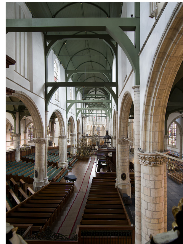
Zicht vanaf het orgelbalkon richting het oosten. De preekstoel staat tegen een pijler aan de zuidzijde van het schip. Eromheen bevindt zich het amfiteatervormige bankenplan uit 1853.