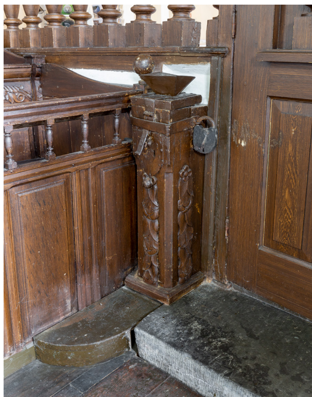
Gijsbert Herman Ripperda liet rond 1666 de kerk opnieuw inrichten. Ook aan de details werd gedacht. Dit offerblok in bijpassende stijl kreeg toen ook een plaats in de kerk.

1738 nogmaals, toen het bord werd overschilderd ten behoeve van een ander familielid. Diverse grafzerken maken duidelijk dat ook hier in de kerk werd begraven. Ook in Oosterwijtwerd zal na 1795 de verplichte verwijdering van de familiewapens en rouwborden een aandachtspunt zijn geweest. Misschien hield men de deuren van het koorhek gesloten. Zo kunnen belangrijke onderdelen in het koor en aan de oostzijde van het schip, waaronder de rouwborden en epitaaf, bewaard zijn gebleven.