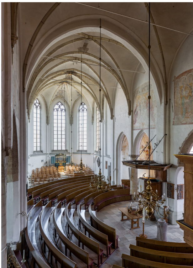
Interieur van de Aaltense Helenakerk vanaf het orgelbalkon. De preekstoel staat centraal, alle banken zijn daarop gericht. Vlakbij de preekstoel staan de avondmaalstafel en het doopvont.

richting van de preekstoel, het centrale punt. Het bankenplan besloeg de gehele ruimte en liep op kunstige wijze door tussen en achter de pijlers van deze driebeukige kerk. De tot op de dag van vandaag aanwezige ronde banken rondom de preekstoel hebben een beschildering met een houtimitatie en nummering.