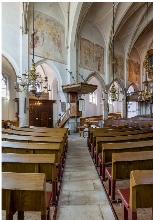
De achttiende-eeuwse preekstoel en het negentiende-eeuwse halfronde bankenplan, dat kunstig tussen en achter de pijlers geplaatst is. De gangpaden vormen een stralenkrans om de preekstoel heen.