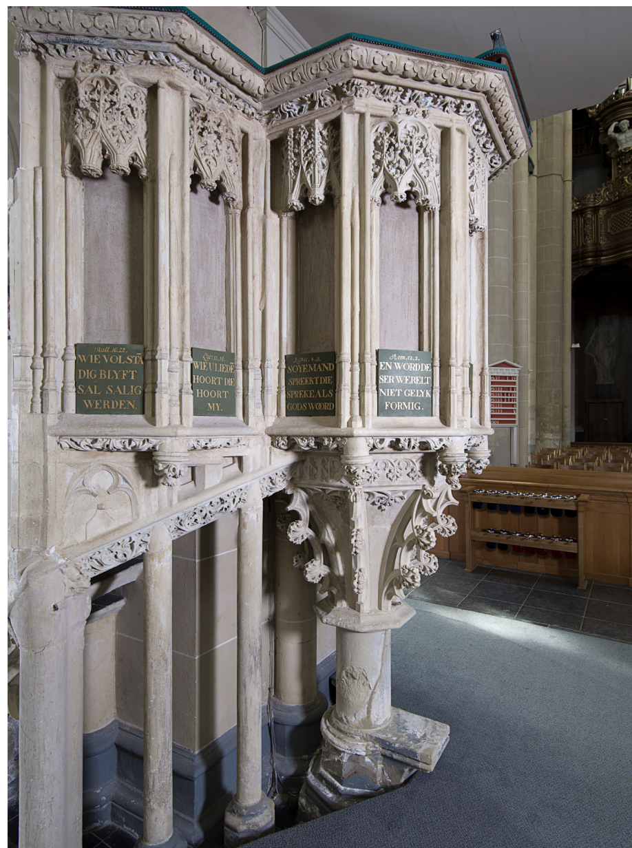
In de Bovenkerk in Kampen bleef de kalkstenen voorreformatische preekstoel uit de vijftiende eeuw bewaard. De heiligenbeeldjes in de nissen werden vervangen door bordjes met bijbelteksten.

Als een voorheen katholieke kerk geschikt werd gemaakt voor de protestantse eredienst, werd het interieur ‘gezuiverd’ van ‘aanstootgevende’ onderdelen, zoals altaren en beelden. Maar lang niet alles werd eruit gesloopt. Wat men kon gebruiken liet men staan en zo bleef ook veel hetzelfde. 3 De bestaande preekstoel in het schip of op de grens van schip en koor bleef meestal in gebruik. Pas in de loop der tijd werden vele vervangen door een fraaier exemplaar. Maar niet allemaal. Veertien exemplaren uit de katholieke periode zijn bewaard gebleven. Vermoedelijk gebeurde dit vanuit praktisch en financieel oogpunt. Waarom een goed functionerend en weinig aanstootgevend exemplaar vervangen? Deze voorreformatische preekstoelen vinden we op verschillende plaatsen in Nederland. Mooie voorbeelden zijn de natuurstenen exemplaren in Tubbergen en de Bovenkerk in Kampen,