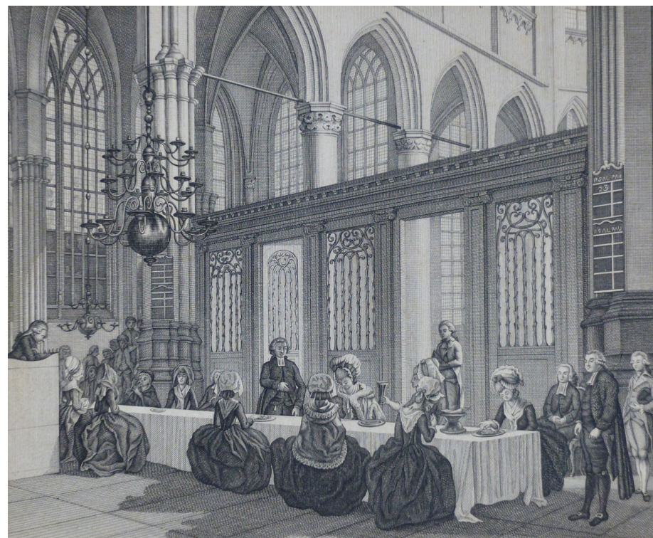
Deze prent van C. Philips uit 1784 toont de viering van het avondmaal in de Amsterdamse Oude Kerk. De zittende vrouwen delen brood en wijn aan een tafel vóór het koorhek.

In de achttiende eeuw werd in veel plaatsen een zittende avondmaalsviering de gewoonte. Deze vond niet langer plaats in het koor, maar in het schip van de kerk, voor het doophek of het koorhek. Een zittende viering komt het meest overeen met het beeld van een maaltijd. In deze nieuwe vorm kon bovendien iedereen zien en horen wat de voorganger deed en zei. De nieuwe vorm vroeg om een nieuwe indeling: voor het doophek of voor het koorhek bood een grote tafel de mogelijkheid om als gemeente het avondmaal te vieren. Een prent van C. Philips uit 1784 toont zo’n avondmaalsviering in de Oude Kerk te Amsterdam.