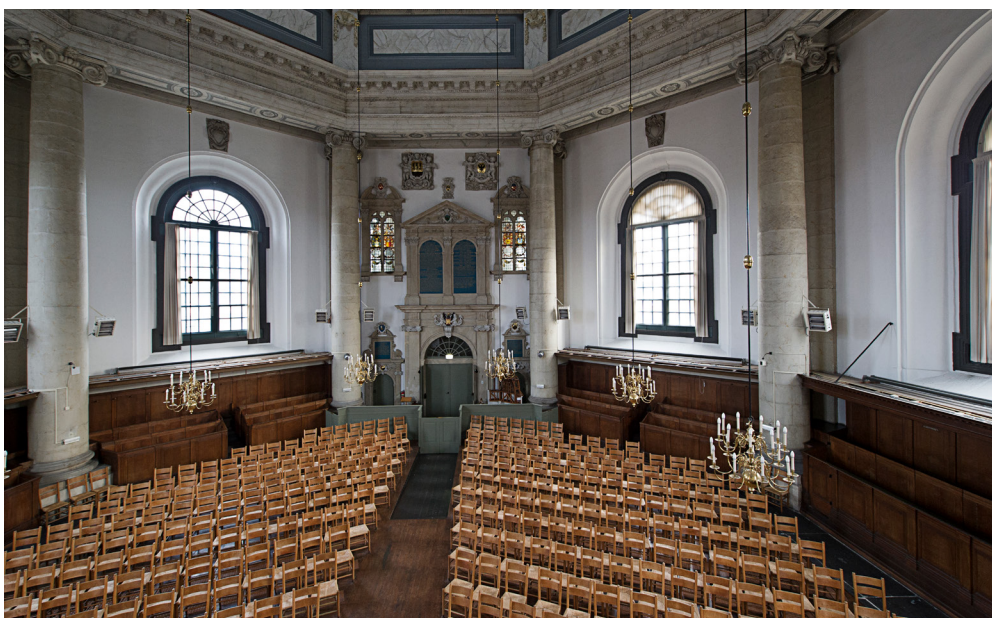
Zicht vanaf het orgelbalkon op het toegangsportaal. De decoratie met reliëfs aan de buitenzijde gaat hier verder. Boven de toegangen staat 'poorte des hemels' en 'huys godes'.

Binnen gaat deze decoratie verder. Teksten boven de toegangen verwijzen naar het gebouw als 'poorte des hemels' en 'huys godes'. Cartouches en wapenschilden sieren het interieur. De ruime toepassing van kwabornament, een geliefd sierelement, maakt duidelijk dat de vormgeving aansluit bij de mode van het midden van de zeventiende eeuw.