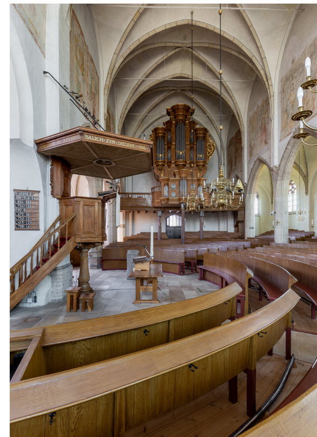
Zicht op het orgel waarvan de barokke kas stamt uit 1757. In het schip hangen koperen kroonluchters, eveneens vervaardigd in de achttiende eeuw.