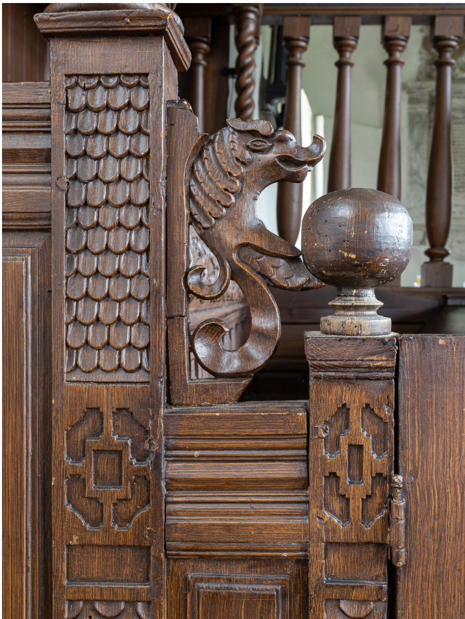
Herenbanken werden vaak rijk versierd met luifels op gedraaide zuilen, guirlandes van houtsnijwerk en familiewapens. De herenbank in de Mariakerk van Oosterwijtwerd heeft uitbundig houtsnijwerk, onder andere schubben en een draakje.

De kerken in de provincie Groningen staan erom bekend dat daar het koor ook na de achttiende eeuw in gebruik bleef voor de avondmaalsviering. 12 Toch werd in de twee grote kerken in de stad Groningen (de Der Aakerk en de Martinikerk) de viering verplaatst naar het schip en werd in 1771 de avondmaalsopstelling in het koor opgeruimd. 13