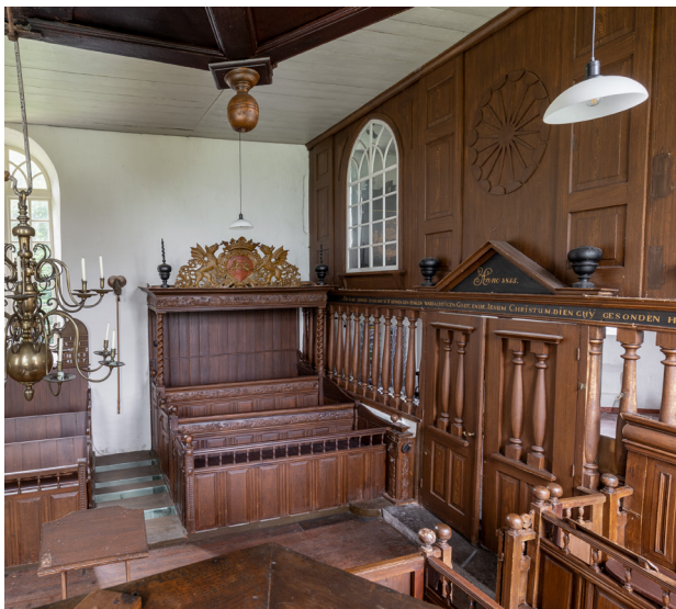
De rijk gedecoreerde bank met het wapen van de familie Ripperda staat tegenover de preekstoel en tegen het balusterhek op de grens van schip en koor.